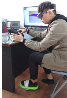
圖 3：產品結合 AR 眼鏡使用情境。