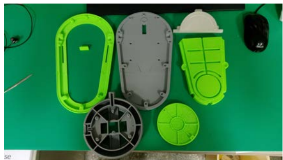
圖 2：產品雛型(3D 列印)。