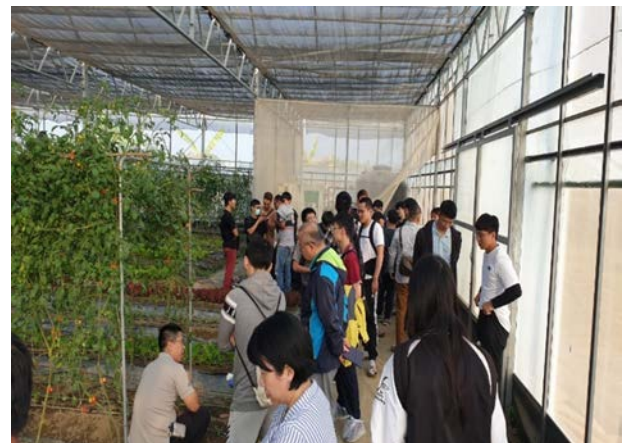
圖 2：108 年 12 月 11 日前往屏東田間職人溫室有限公司進行教學見習