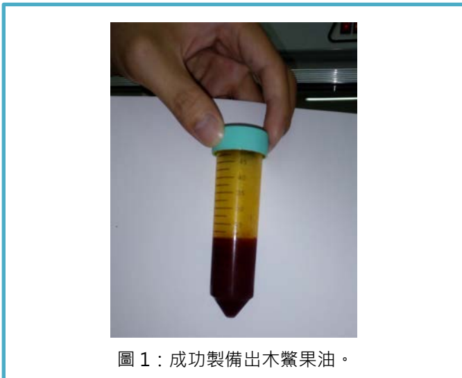
圖 1：成功製備出木鱉果油。