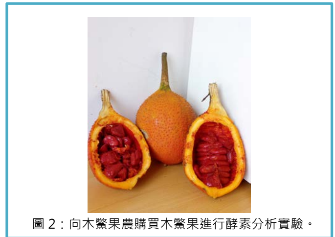
圖 2：向木鱉果農購買木鱉果進行酵素分析實驗。