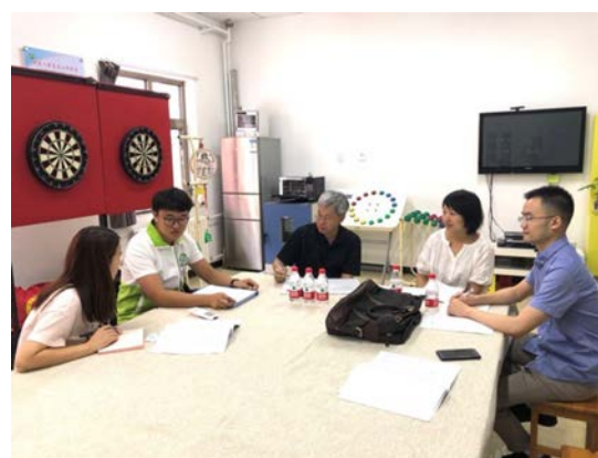
圖 2：訪談立德社會工作事務所。