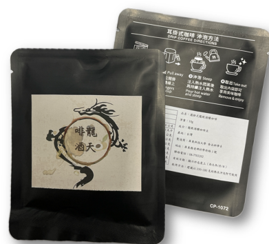
圖 4：五、龍眼酒釀咖啡包產品。