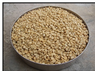
圖 1：台灣本土帶殼咖啡豆。